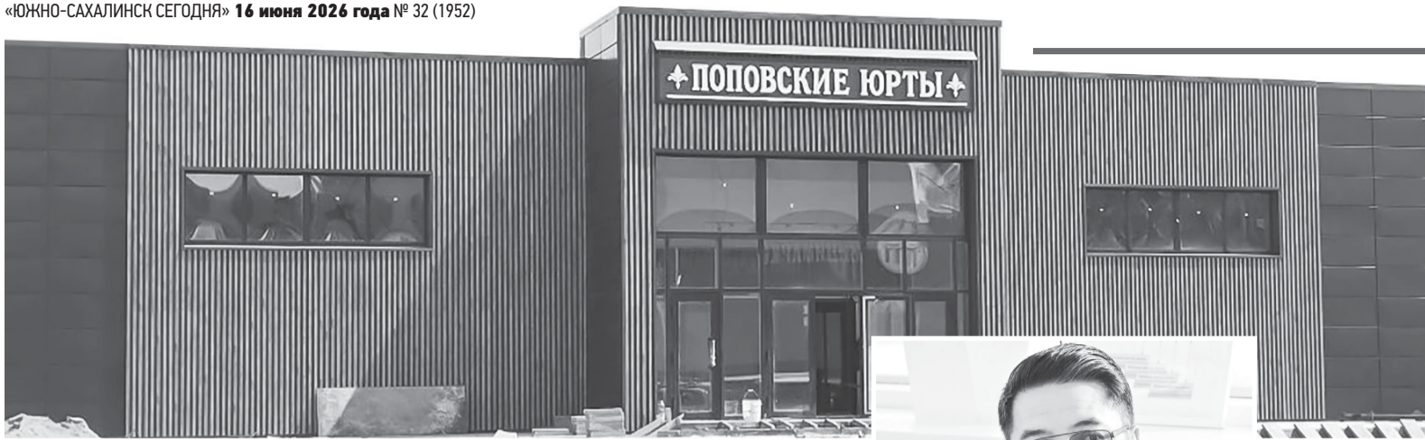
► Нестандартное название уже привлекает внимание