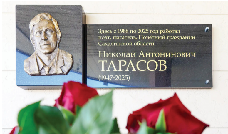
► Мемориальную доску изготовил скульптор Владимир Чеботарев

Сахалинскую областную универсальную научную библиотеку (СахОУНБ) уже стали называть «Тарасовкой»