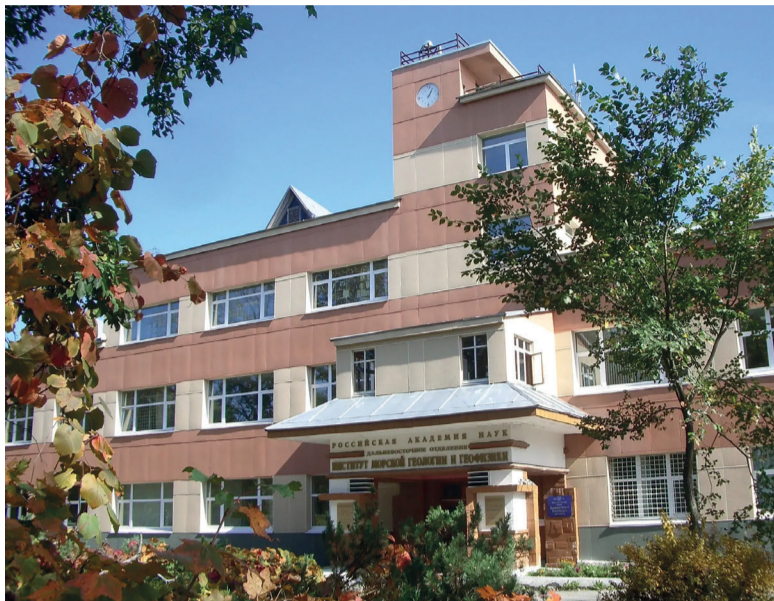
► Уникальное здание ИМГиГ – портал в мир науки

Если резюмировать, главное наше достижение – то, что ИМГиГ приносит реальную пользу нашему региону.