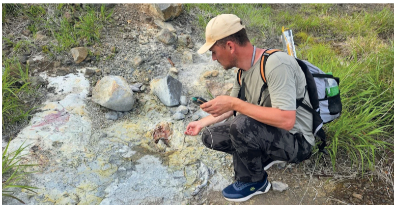
► Объект исследования – водогрязевый котел на Итуруп

– Лето для вас – экспедиционный пор. Чем планируете заниматься?