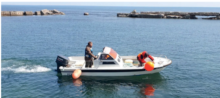
► Сотрудники института работают в Охотском море