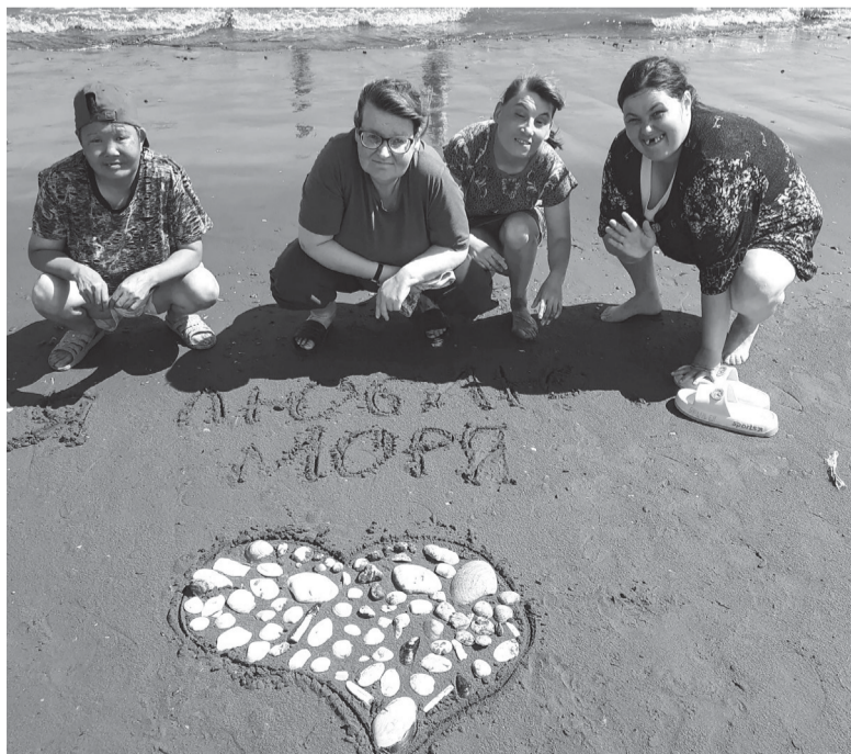
► Выезд на море повышает настроение постояльцам интерната

В интернате сейчас около 500 проживающих. Есть мужские и женские отделения, а также «Милосердие», где находятся те, кто в силу заболевания не может сам себя обслуживать. Много и активной молодежи, которая, несмотря на ограниченные возможности здоровья, работает, занимается спортом и даже участвует в различных соревнованиях – от спартакиад среди людей с ОВЗ до «Абилимпикса». И всем необходимо уделять внимание.