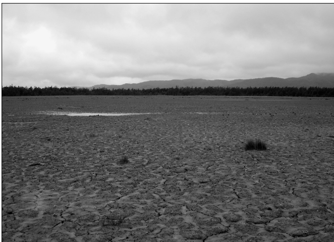
Рис. 2. Грязевое поле после сильного извержения Главного Пугачевского грязевого вулкана зимой 2005 г. 2007 г.