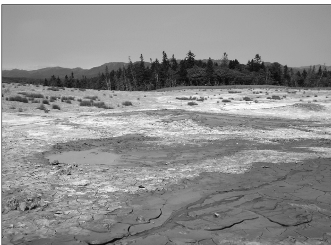
Рис. 3. Группа активных грифонов Южно-Сахалинского грязевого вулкана со свежими излияниями водогрязевой смеси. 2008 г.

вулканов (свежие грязеизлияния, газовые выбросы, сейсмогенное трещинообразование), вероятно, были вызваны Углегорским землетрясением 5 августа 2000 г. [12].